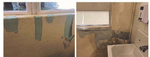
Le CLAE (centre d'accueil) de la Louvière EELV/Rambouillet

La municipalité communique beaucoup sur les travaux réalisés dans les écoles et les CLAE (Centre de loisirs après l'école). Lors du dernier conseil municipal du 13 juin, nous avons fait observer que le budget de la rénovation de celui de Clairbois est pharaonique (presque 12 millions d'euros), alors que celui de la Louvière est dans un état de délabrement honteux, comme peuvent le voir les enfants et leurs parents tout au long de l'année et comme ont pu le constater les électeurs se rendant dans les bureaux de vote 3 et 12. On se demande quel est le planning de ces travaux, suivant quelles priorités.